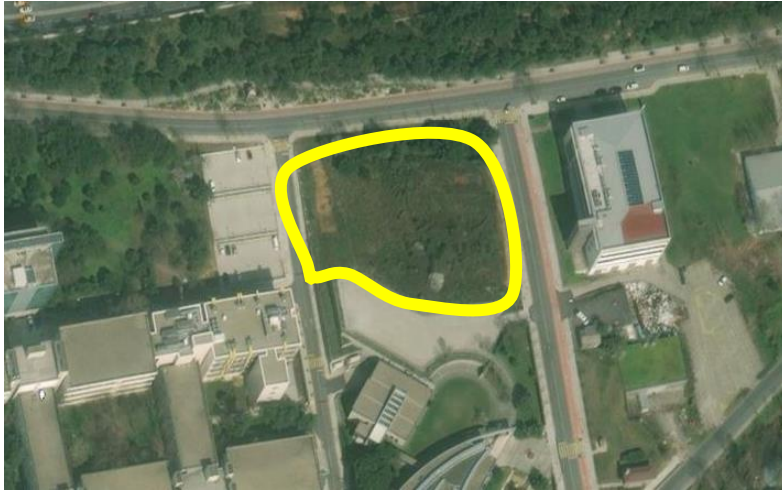
Yarışma Alanı Uydu Fotoğrafi

Proje alanı İTÜ Ayazağa Kampüsü içerisinde Teknokent Binası karşısındaki boş parsel olarak belirlenmiştir. Parsele ait uydu görüntüsü aşağıda verilmiştir. Arazi (.dwg) dosyası yarışmacı takımlar ile e-posta yolu ile paylaşılacaktır. Arazi yanında bulunan otopark alanı araziye dahil değildir.